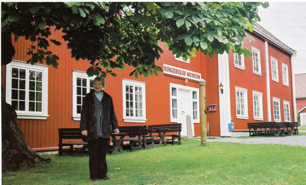
Håkerud kan stolt vise frem ferdigrestaurert prestegård. Næringslivet på Ringerike har spart lokalpolitikere for gapestokken (midt på bildet)!

Siden både prestegården og kulturlandskapet er av nasjonal verdi, ble det stilt strenge krav til hvordan vedlikeholdet skulle utføres. Huset var opprinnelig malt med linoljemaling, men hadde senere fått omgang med alkydøljemaling. Løs maling, svertesopp både ytterst, innerst og mellom malinglagene krevet faglig funderte tiltak. Panelet ble skrapet og børstet for løs maling, deretter fulgte salmiakkbehandling